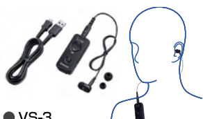
● VS-3 Bluetooth®ヘッドセット