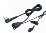
● HM-166LS 小型イヤホンマイクロホン