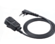
● HM-238LS タイプイン型マイクロホン ※EH-15、SP-28と 組み合わせて使用可能