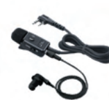
● HM-153LS イヤホンマイクロホン