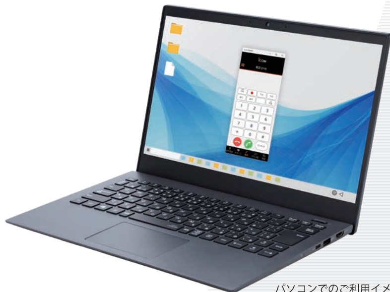
パソコンでのご利用イメージ